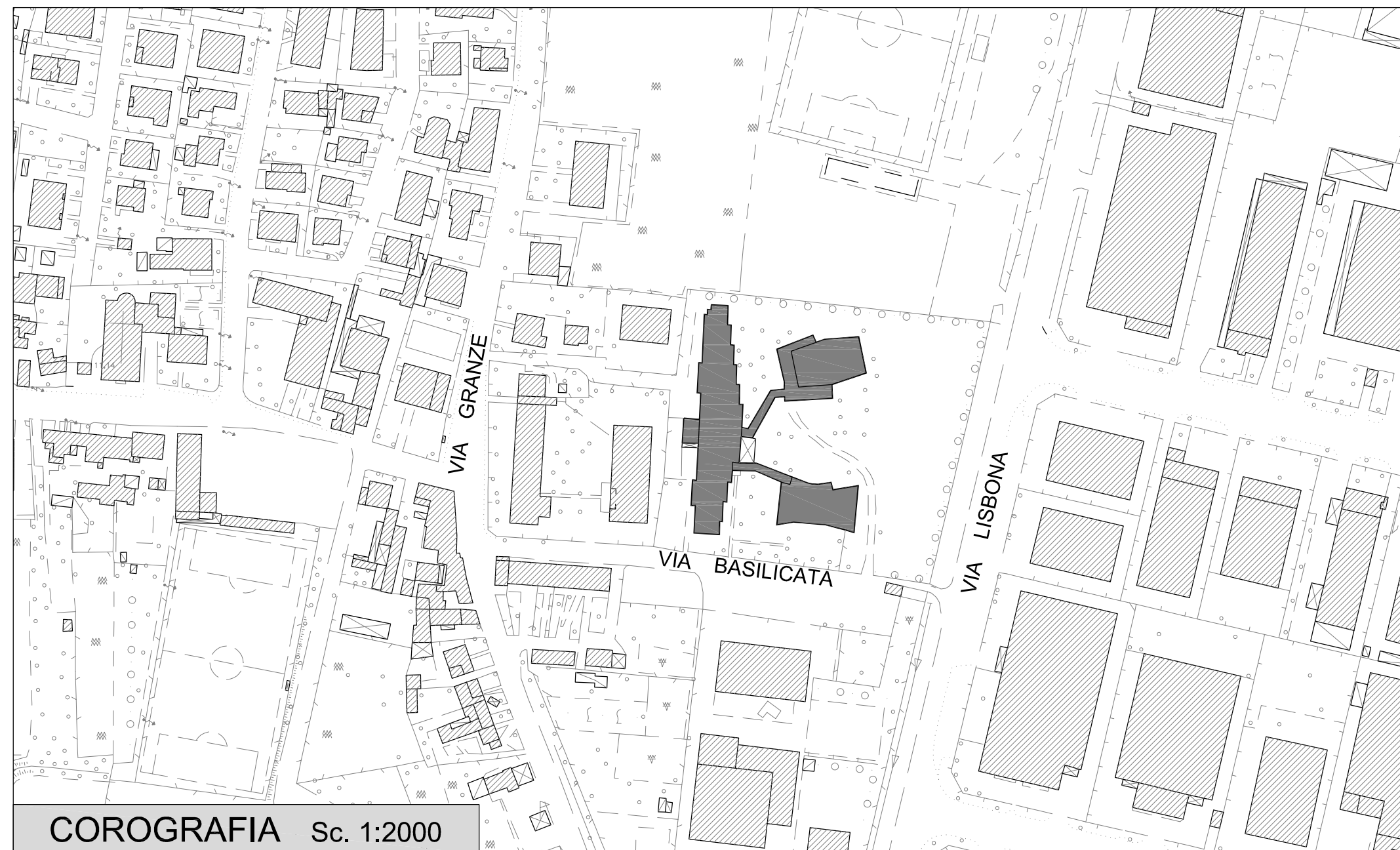
COROGRAFIA Sc. 1:2000